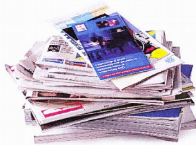
Les journaux, magazines, catalogues, papier administratif