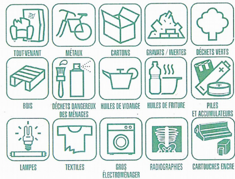
Les déchets volumineux ou dangereux sont à apporter dans l'une des huit déchèteries du territoire